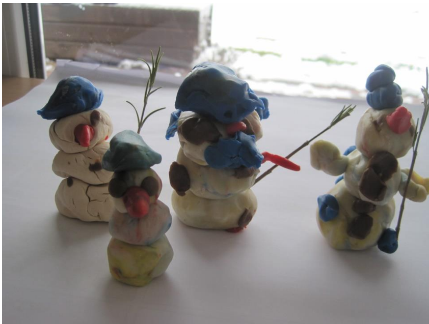
Schneemänner können geknetet werden oder auch die Vögel des Winters oder, oder, oder