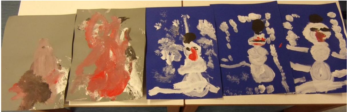
Die gelben Zwerge haben Ihre Schneemänner mit Pinsel und Farbe verewigt.